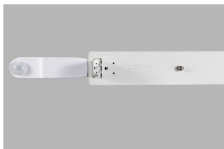
AirZing 5040 Product