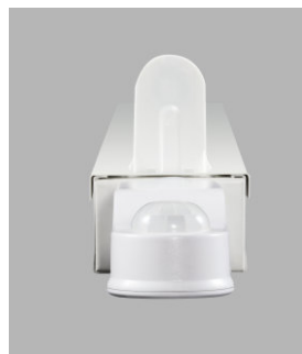
AirZing 5040 Product